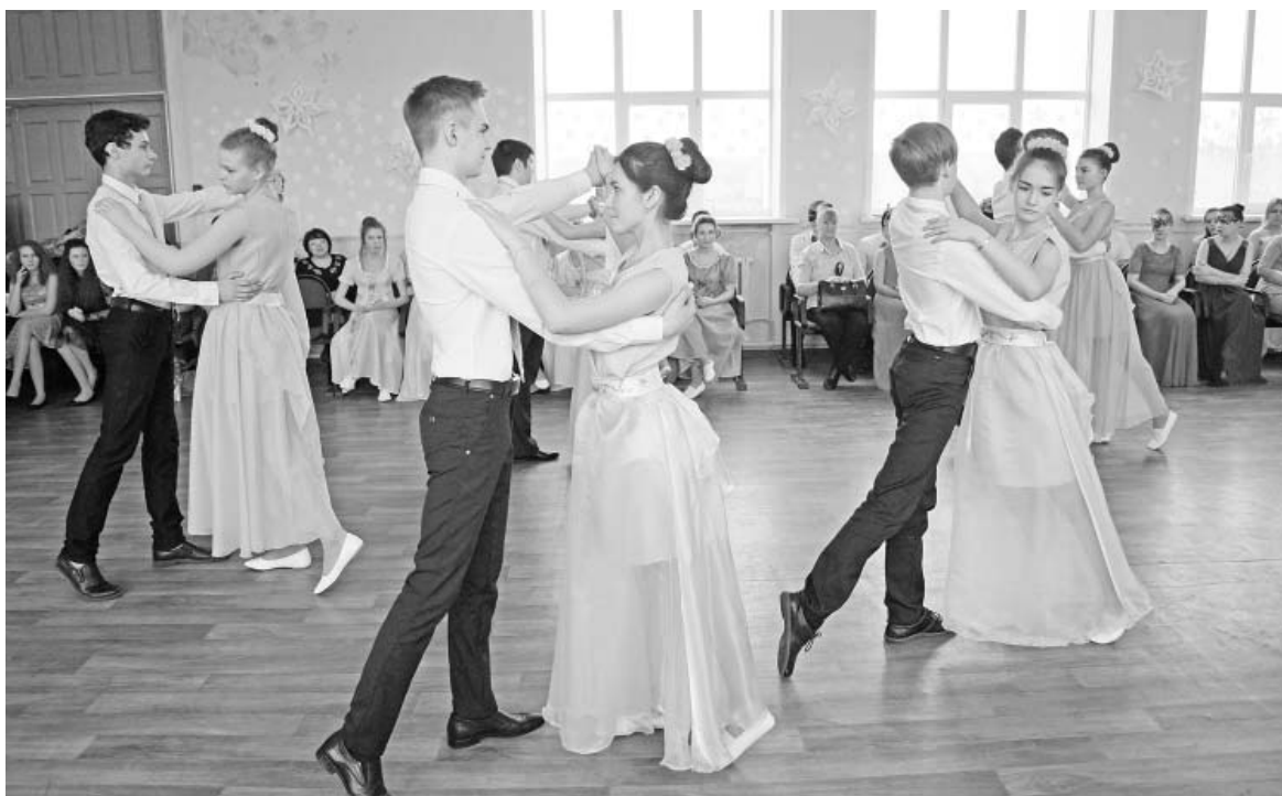
Дамы и кавалеры Паликской СОШ №2.

Название и всех последующих танцев неизменно - вальс. Оказывается, он может быть не только классическим, но очень разным и по темпу, и в смысле вариаций движения, более и менее сложный