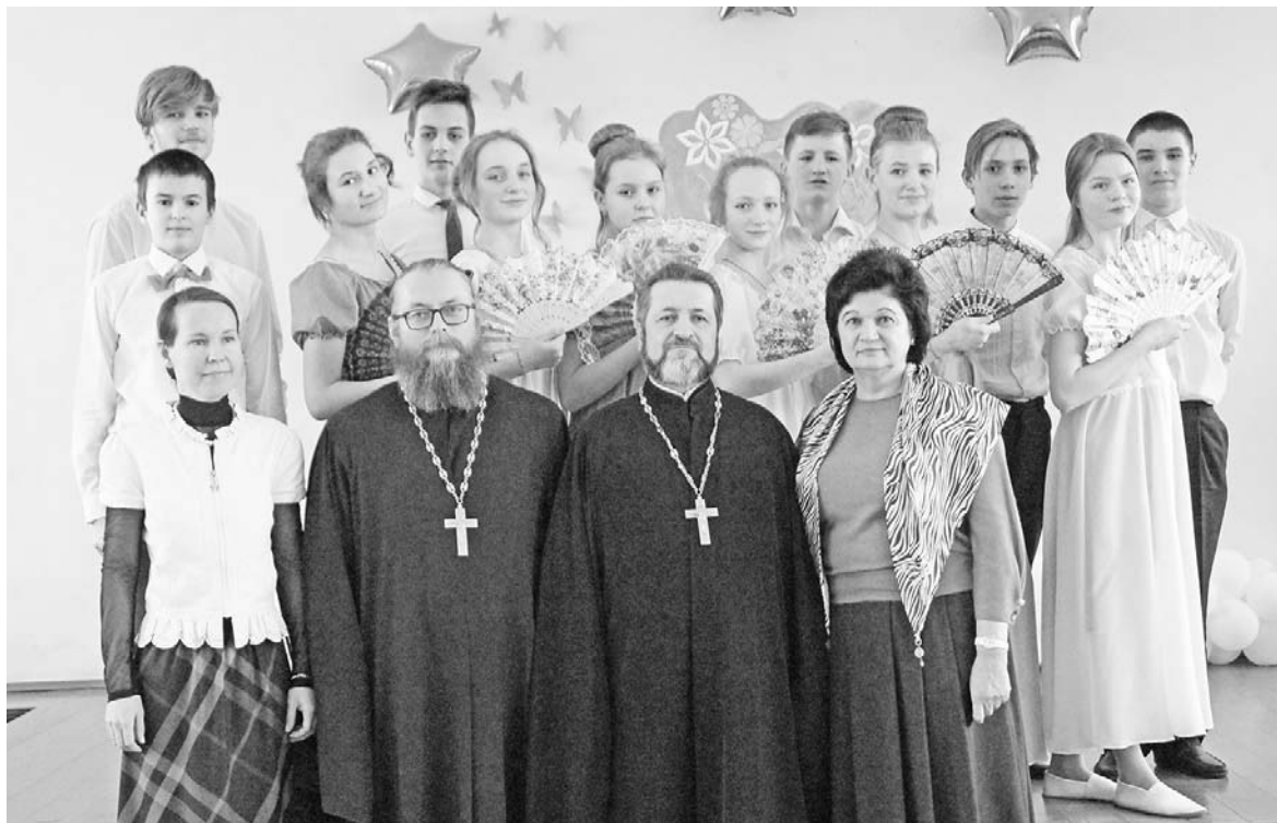
Снимок на память. На заднем плане танцоры из Чернышена.