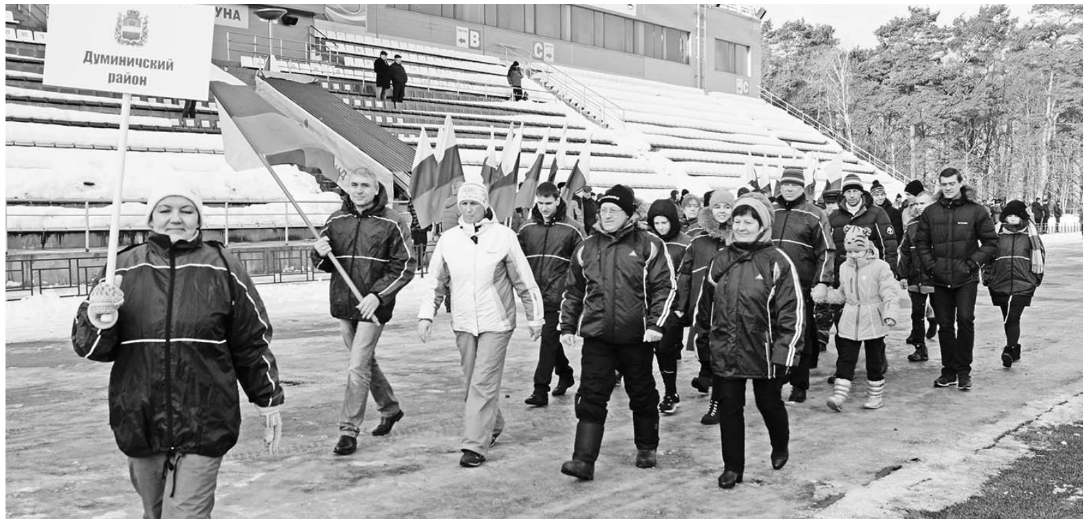
Парад участников. Команда Думиничского района.